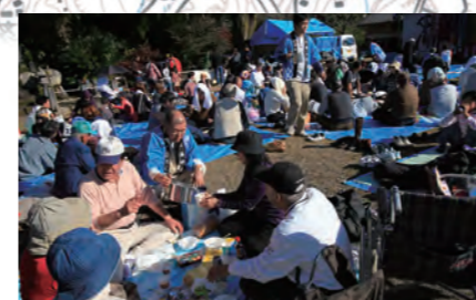
11月23日に熊野市育生町の大森神社でおこなわれる「どぶるく祭」 八百年も続く伝統の祭です。