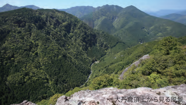
大丹倉頂上から見る風景