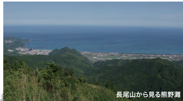
長尾山から見る熊野灘