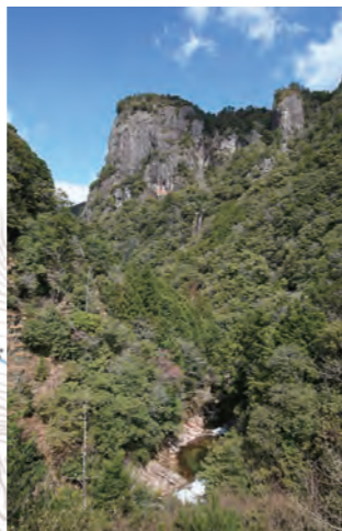
見る人を圧倒する巨岩「大丹倉」