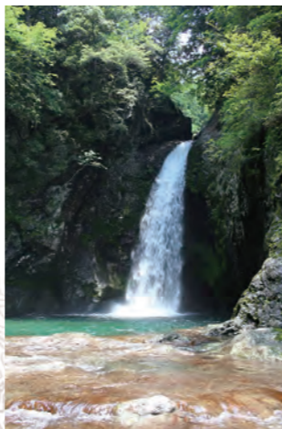
アメノウオ伝説が残る雨滝 △813.5