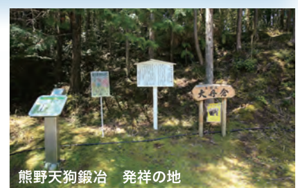
熊野天狗鍛冶 発祥の地