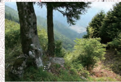
一の水峠にある「髪梳地藏」 写真右側に見えるのが熊野市井戸町瀬戸の集落